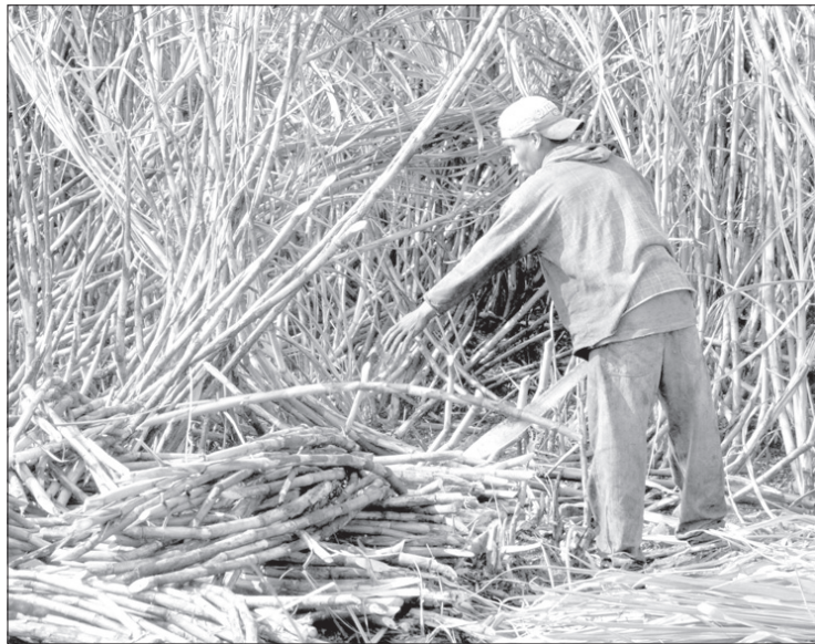
Las condiciones de los campesinos no mejoraron en lo sustantivo