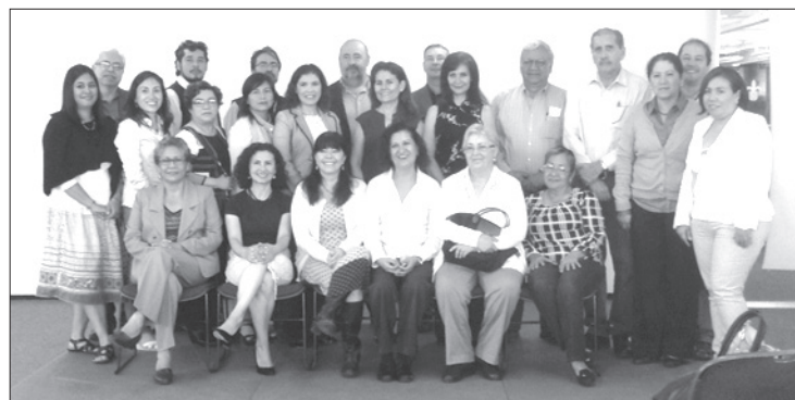
El grupo quedó integrado formalmente

Asimismo, informó que de 14 estudiantes de la sede Xalapa, ocho realizaron movilidad en universidades de España y tres en la UNAM. De Orizaba, uno viajó a