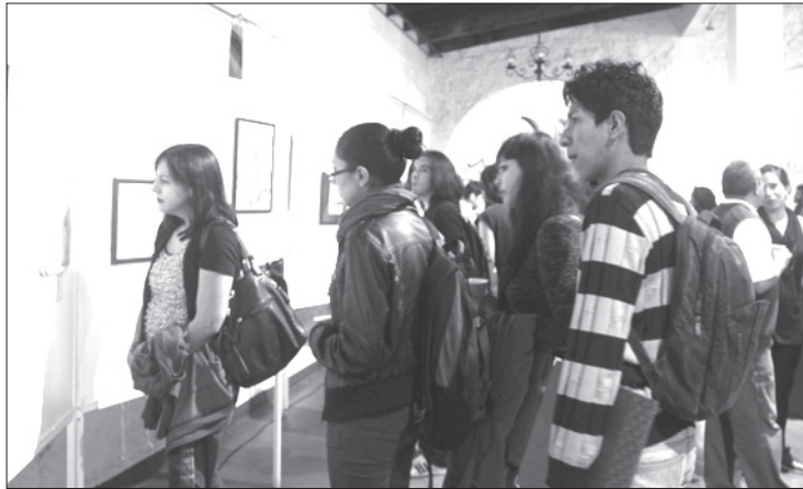
Evocaciones y Circunstancias permanecerá abierta hasta el 25 de noviembre

La exposición consta de alrededor de 50 piezas. Los géneros