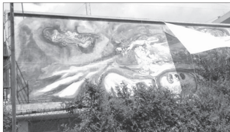
Los trabajos concluirán en dos meses

"Como universidad pública, dependemos del recurso que nos proporcionen los gobiernos federal y estatal, el cual no es suficiente; no obstante, buscamos fuentes de