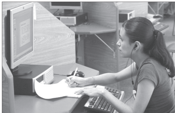
Las TIC y el Internet pueden mejorar la calidad del aprendizaje

El e-learning debe facilitar y garantizar al aprendizaje, brindar la posibilidad para que la persona sorda decida dónde y cuándo estudiar, y no necesite contratar a un instructor particular o un intérprete de lengua de señas.