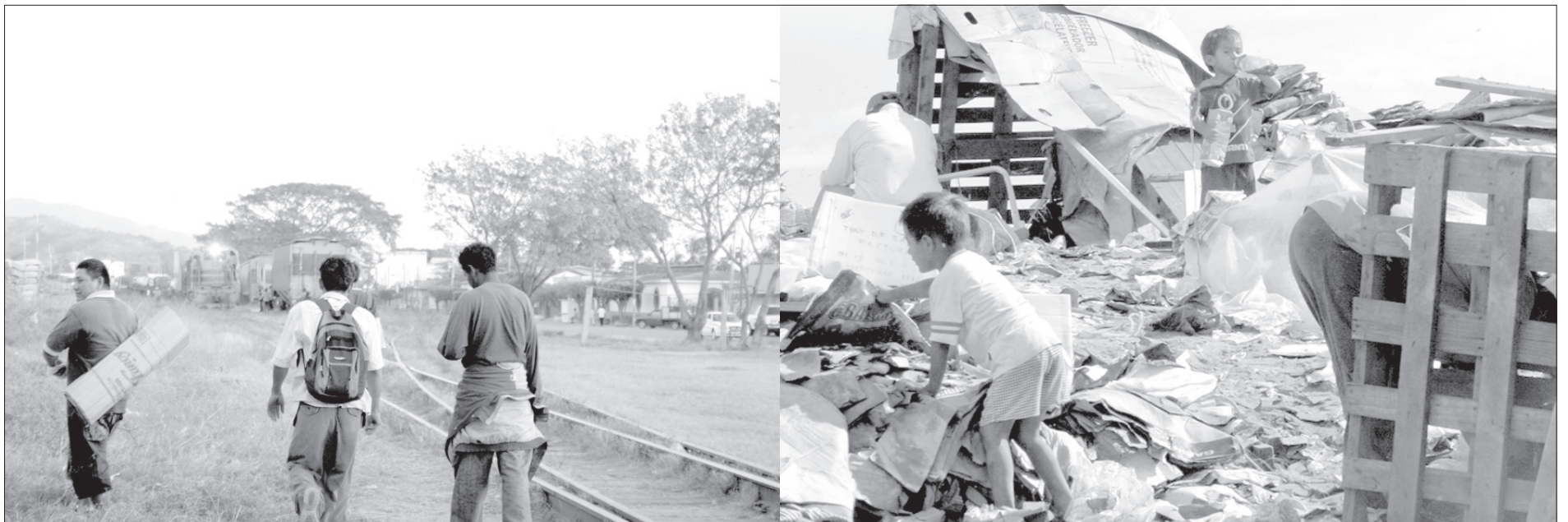
Ante el abandono del Estado, aparecieron fenómenos como la migración y el empobrecimiento

“Es todavía poco lo que conocemos sobre la Revolución. A nivel de investigación histórica se ha quedado inconclusa, es necesario volver a ella para poder explicar nuestra sociedad contemporánea, así como sus problemas y soluciones”, concluyó.