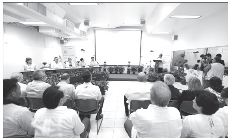
Consejeros y autoridades regionales acudieron al evento

Acreditación, rediseño de planes de estudios, fortalecimiento de la planta académica e incremento de la infraestructura, los aspectos más importantes del periodo