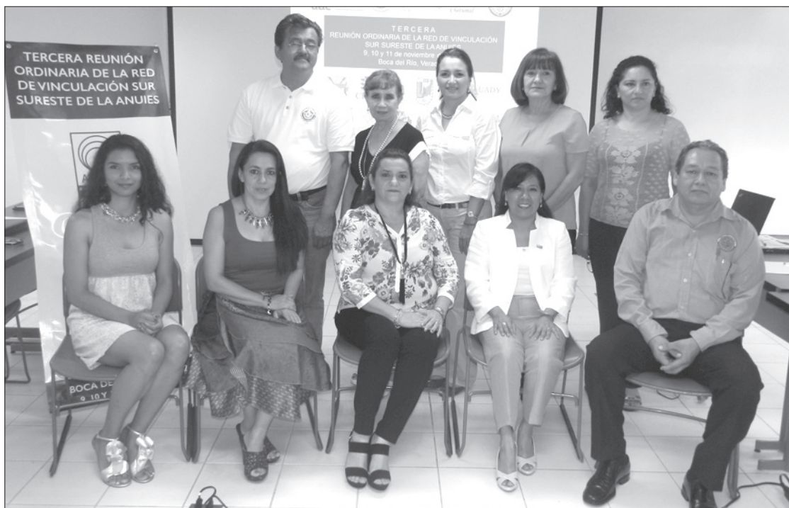
Integrantes de la Red de Vinculación Sur-Sureste de la ANUIES

Destacó el trabajo de vinculación comunitaria que realiza la institución y precisó que a través de las Casas de la Universidad, las Brigadas Universitarias en Servicio Social y el programa Peraj, se apoya a las comunidades para una transformación social.