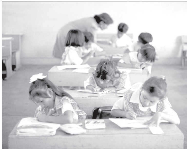
Pese a las reformas, no se ha abatido el rezago educativo