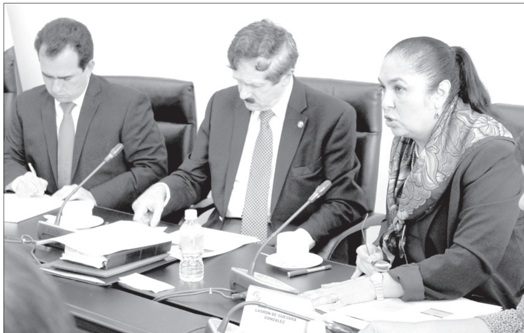
La Rectora dialogó con las comisiones de Educación y de Hacienda y Crédito Público

Este último, dijo que la Universidad debe continuar con sus tareas y que no se debe perjudicar sus actividades, con fluidez y sin afectación para la sociedad.