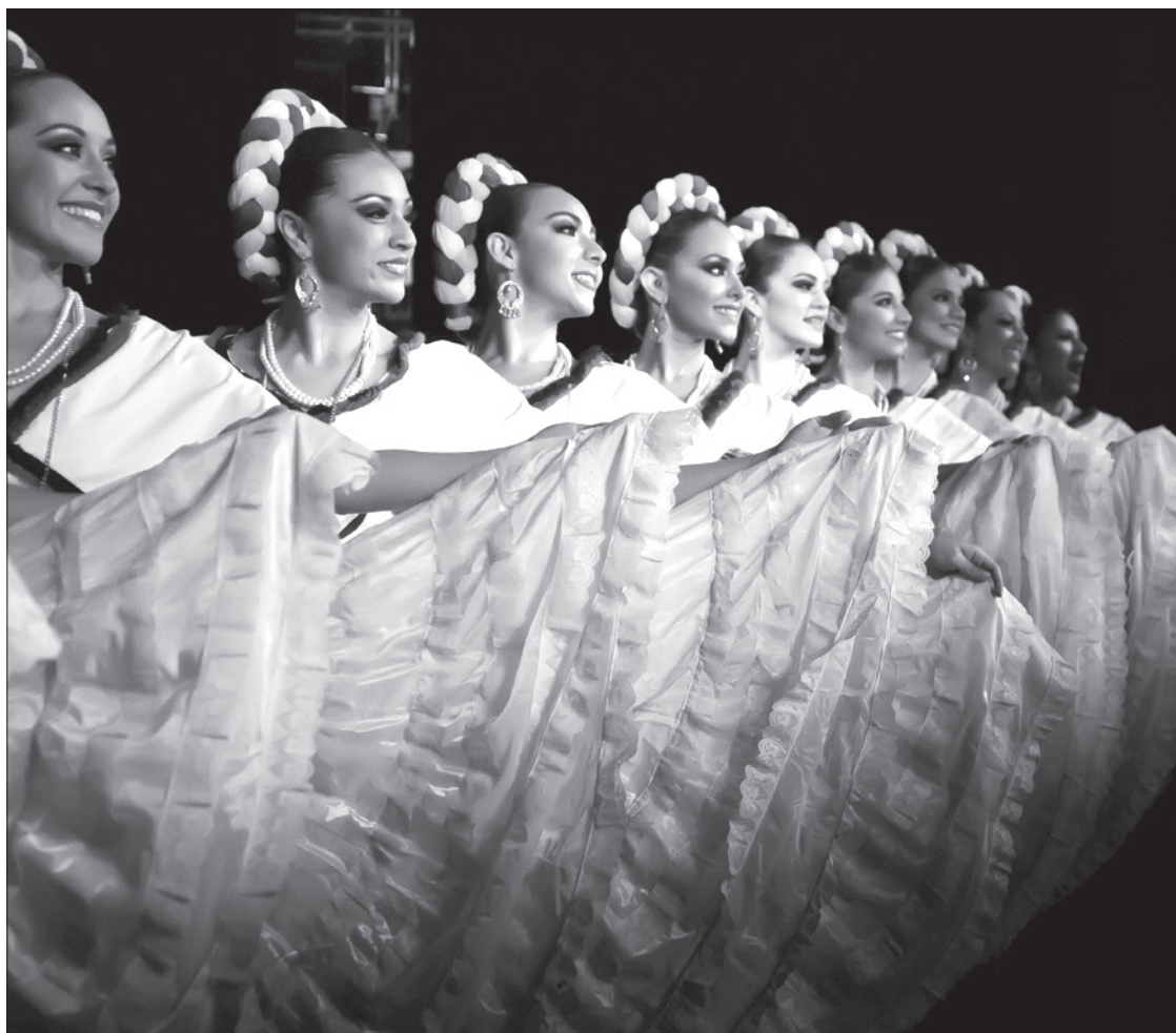
La agrupación ha representado a la Universidad, el estado y el país alrededor del mundo

Los tres, al lado de un gran equipo de maestros, bailarines, técnicos y promotores, entre otros, han logrado posicionar a este ballet como unos de los mejores de México y el mundo a lo largo de cuatro décadas.