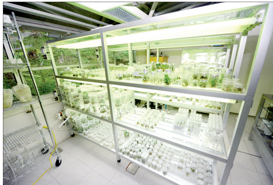
Área de cultivo de tejidos vegetales