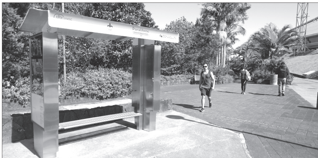
Se ubica en la explanada del recinto

El Paralibros, estructura metálica que asemeja una parada de autobús, es un recurso gratuito para fomentar la lectura entre la comunidad universitaria, dotado inicialmente de un acervo de 365 libros, al que se sumarán los volúmenes editados por la misma Universidad y el Ivec .