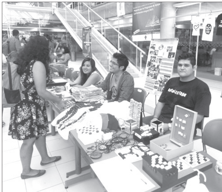
El evento registró buena asistencia

Esta última agradeció a los asistentes al evento, pues con sus proyectos, actividades y saberes contribuyen “a mejorar los entornos