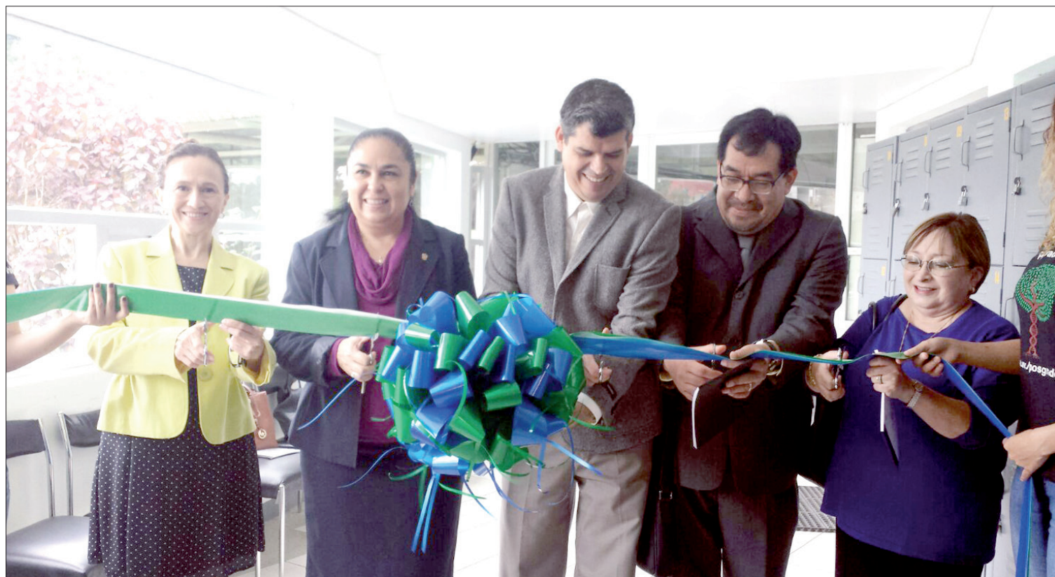
La Rectora inauguró la ampliación de esta entidad académica

La participación del Inbioteca en 26 eventos nacionales y cinco internacionales es muestra de la labor académica del organismo. En materia de investigación, han sido registradas cuatro patentes.