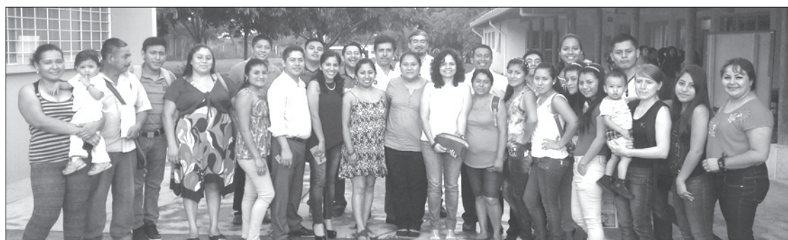
La reunión se efectuó en Huazuntlán