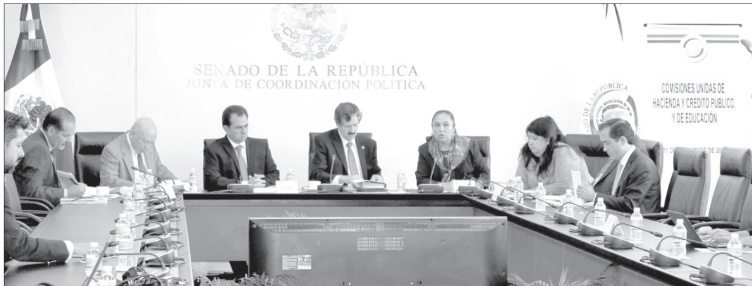
Los legisladores conocieron de primera mano la situación financiera de la Universidad