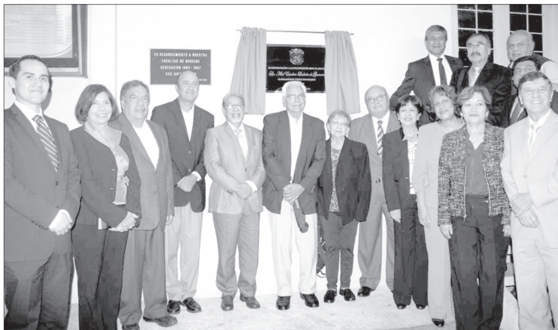
Integrantes de la generación 1968-1972, de Derecho