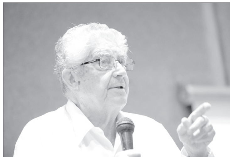
El investigador dio la conferencia inaugural del evento

Recordó a los presentes que los académicos de la UV han elaborado manuales de atención que han sido revisados por la Comisión Nacional Contra las Adicciones ( Conadic ) y pueden servir de apoyo en la creación de comités de salud municipales para atender el problema de las adicciones.