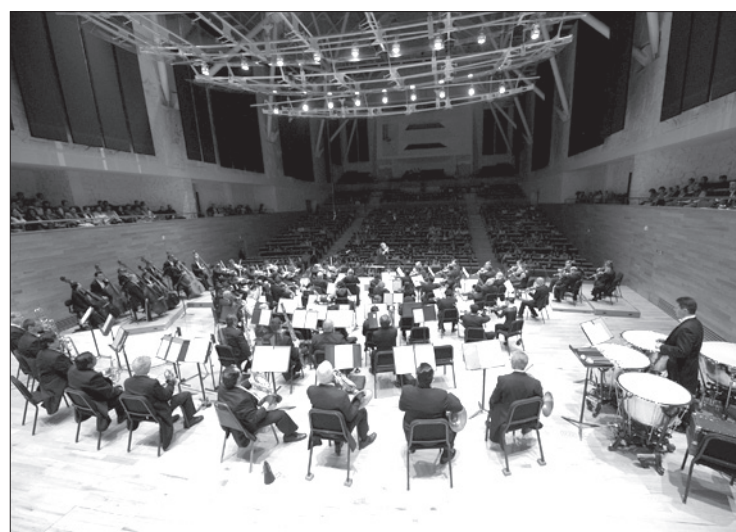
La sesión permitirá explorar las condiciones acústicas del recinto

La Guía de la orquesta para los jóvenes se conoce también como "Variaciones y fuga sobre un tema de Purcell", y fue concebida como una obra didáctica en que el autor presenta un tema inicial procedente del compositor barroco inglés Henry Purcell. Este motivo es desarticulado ingeniosamente mediante una serie de variaciones y con las diversas secciones de la