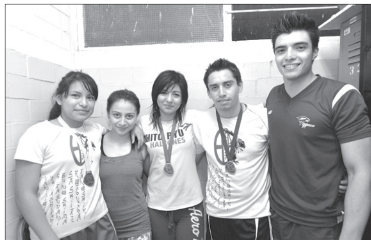
Integrantes del equipo de Karate Do

Señaló que la meta para la próxima universiada es mejorar el desempeño que tuvo en Nuevo