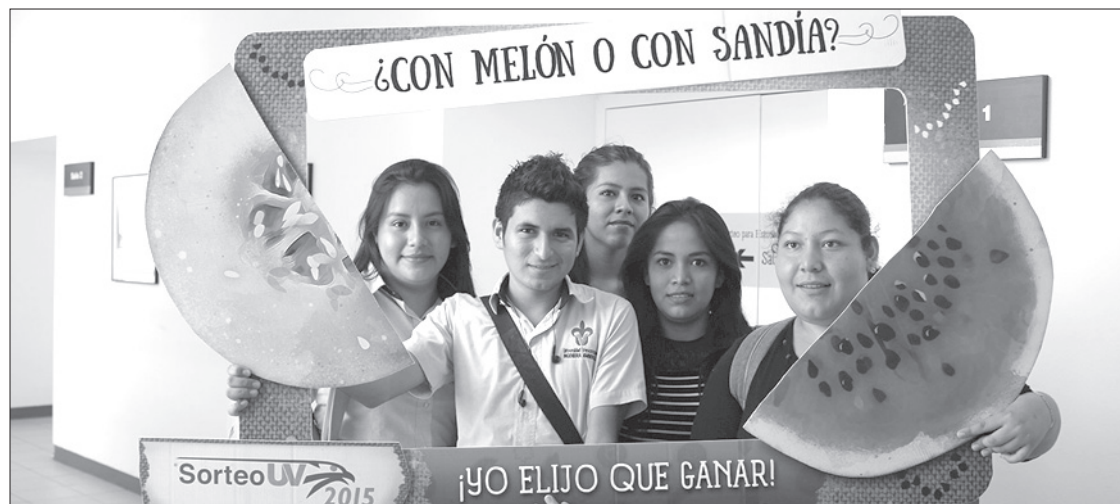
El Sorteo para Estudiantes fue todo un éxito