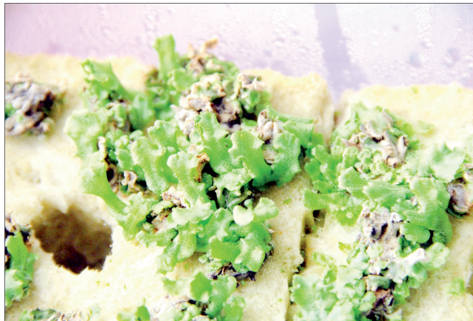
El Instituto resguarda la planta más antigua del mundo: Marchantia Polymorpha

Entre los retos del Inbioteca está la consolidación académica; y en materia de infraestructura, garantizar el suministro eléctrico estable, fortalecer al personal técnico académico y administrativo.