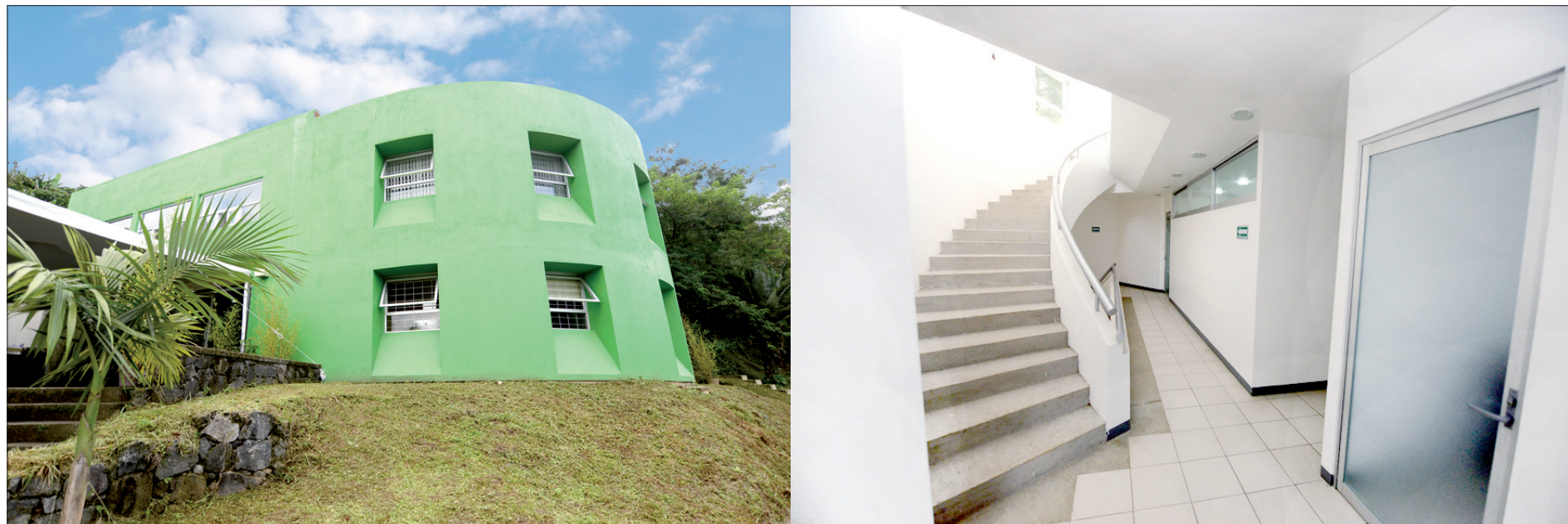
Las nuevas instalaciones fortalecerán el desarrollo de la investigación

Ambos se encuentran avalados por el Consejo Nacional de Ciencia y Tecnología ( Conacyt ) y están en el Programa Nacional de Posgrados de Calidad (PNPC).