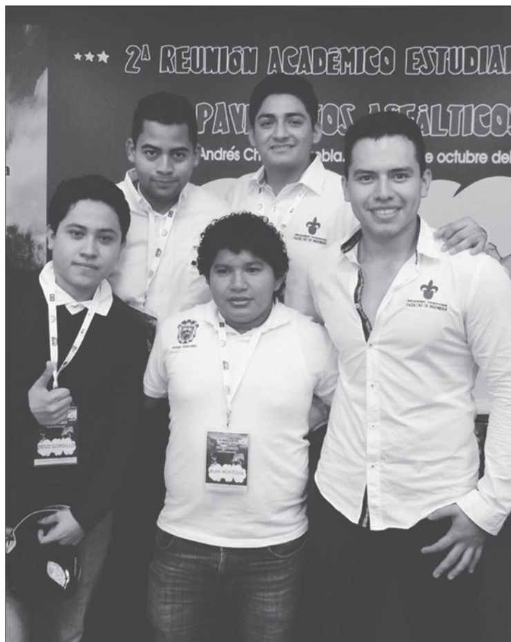
Estudiantes de séptimo y noveno semestre conformaron el equipo